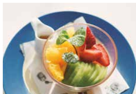
季節のフルーツボウル 680(+税)