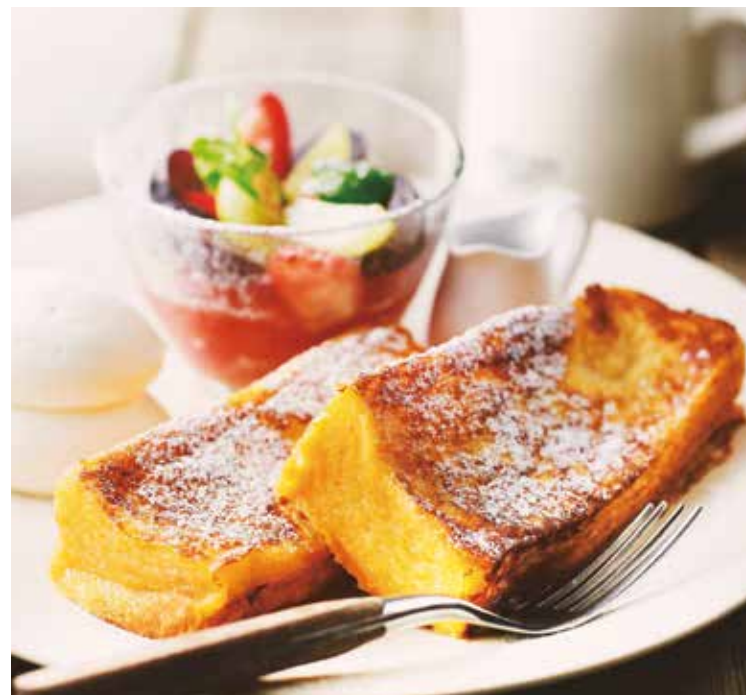
★ONIJUSフレンチトースト 1400(+税) w/季節のフルーツボウル