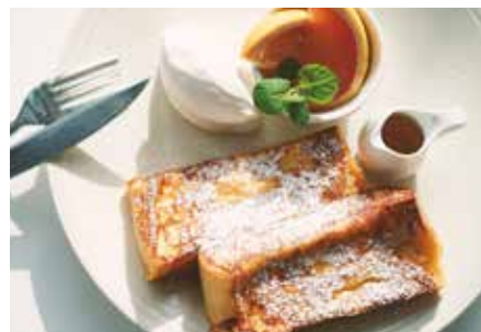
★ONIJUSフレンチトースト 980(+税) w/フルーツカップ

ONIJUSフレンチトースト 焼き上がりにお時間を頂戴しております。 長時間オリジナルのアパレイユに漬けて、低温でじっくり焼き上げます。